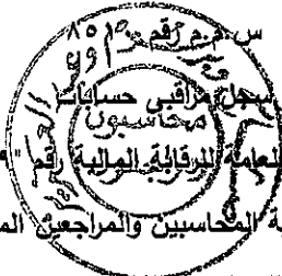
كامل مجدى صالح